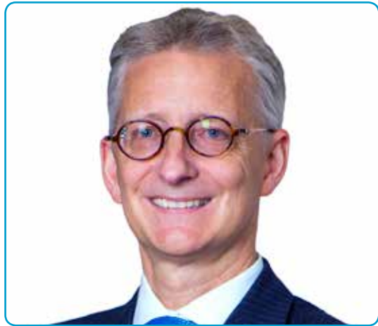
السيد / جان لويس لوران-جوسي الرئيس التنفيذي